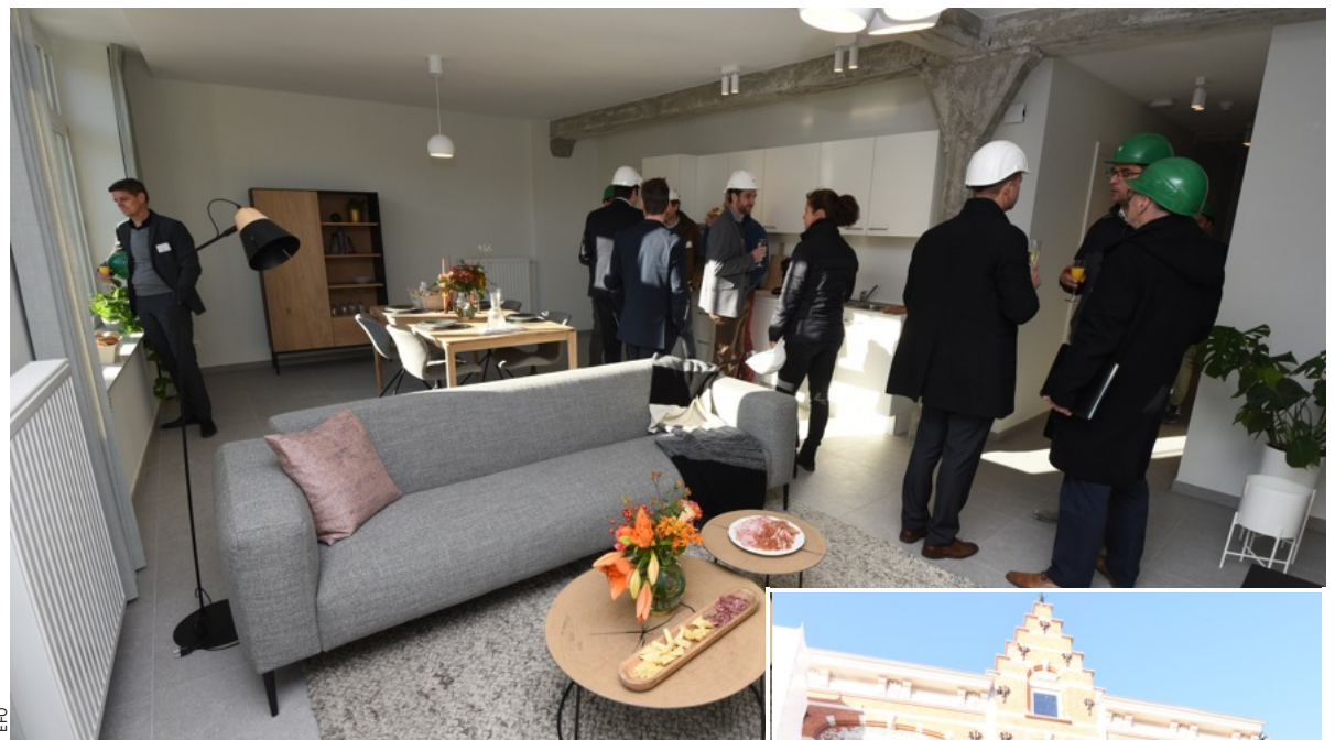
■ Sinds begin dit jaar onderging de site een metamorfose.