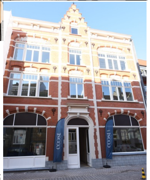
■ Op de benedenverdieping komt er een brasserie.

Ook de Oostendenaar die nog even de nostalgie wil opsnuiven, zal welkom zijn. De nieuwe naam Coost verwijst naar de kust, de stad en de geschiedenis. Toch valt het oog voor detail op: zo werden tal van authentieke elementen behouden en werd ook de gevel gerestaureerd. Aan de hand van brokstukken van de gevel en de originele plannen uit 1928 werden